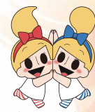
ミビョーナ・ミビョーネ (かながわ未病改善宣言イメージキャラクター)